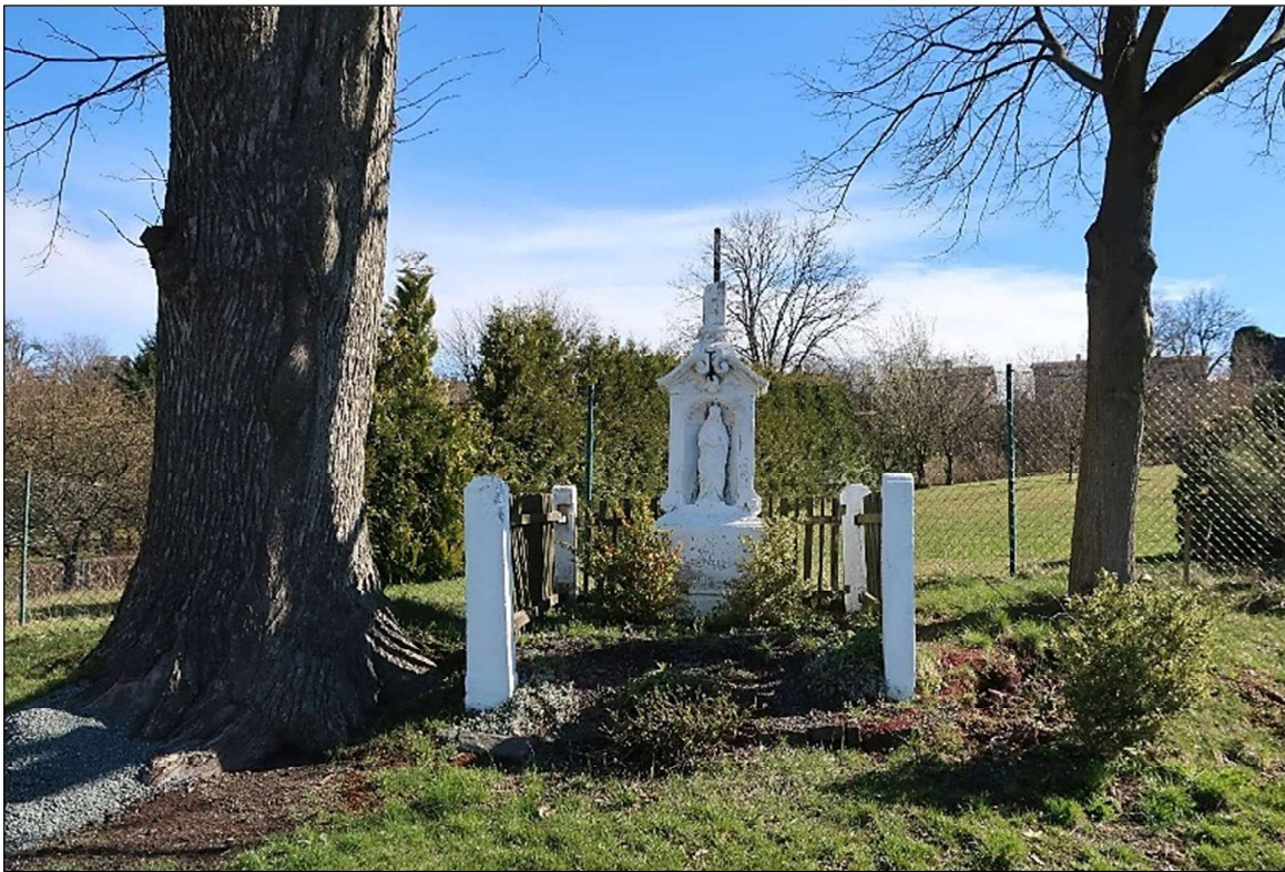
Lípy, mezi nimiž Špulákův kříž stojí, byly odborně ořezány a starší lípa byla v koruně zajištěna lany proti rozlomení. Stav 10. 3. 2024: