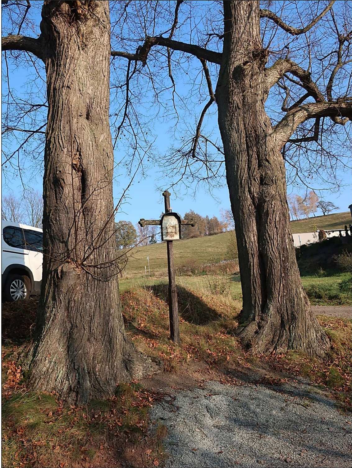
Lípy jsou dosti vzrostlé: