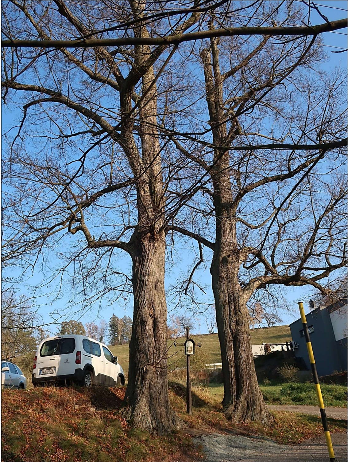
Pohled na kříž a lípy z druhé strany: